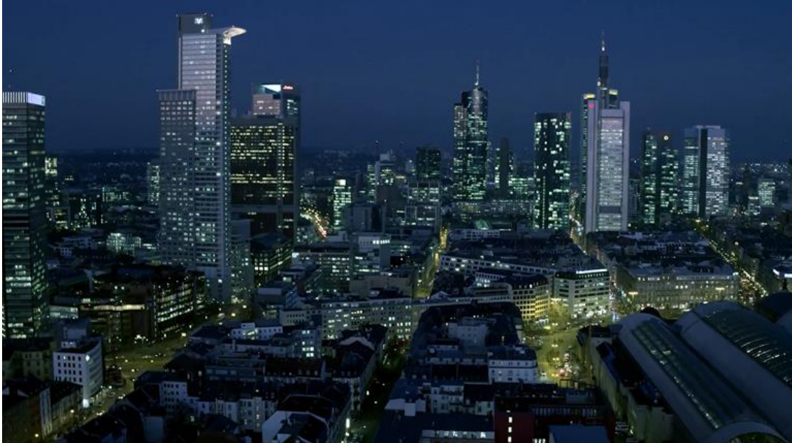
Ausblick aus dem VIRAGE