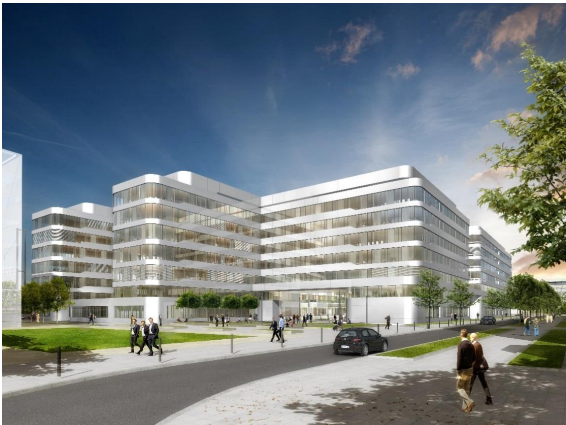
Der Neue Adam-Riese-Platz