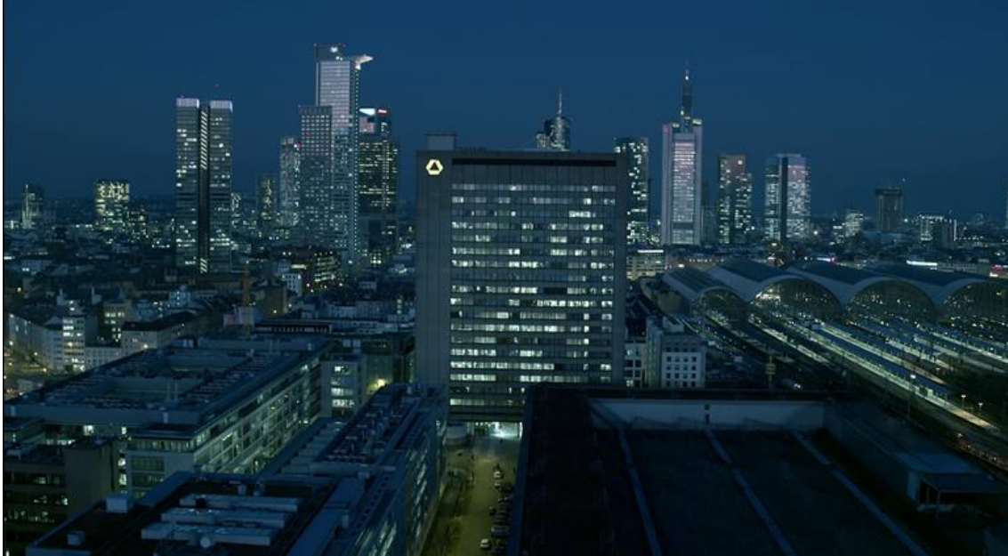
Heute das einzige Hochhaus am Hauptbahnhof und deswegen ein gefragter Standort für Fotografen