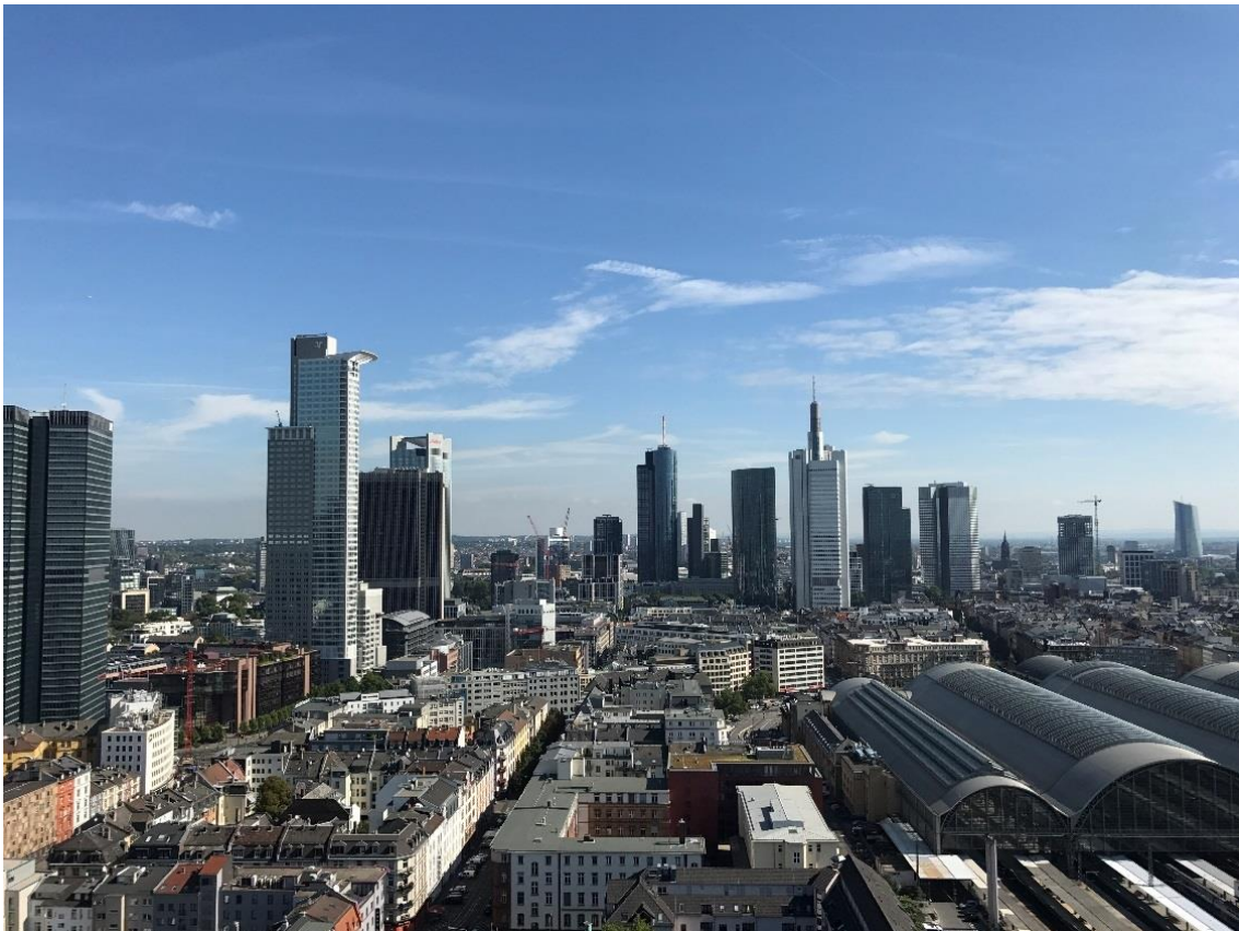
Ausblick aus dem VIRAGE