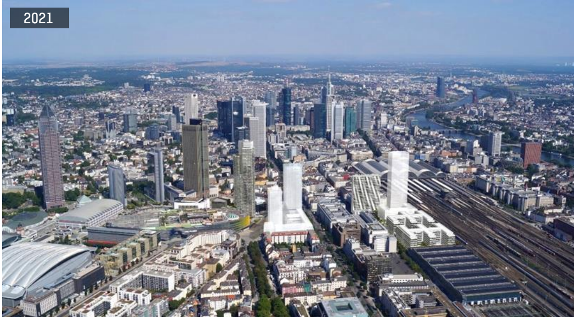
Das größte Neubau-Hochhaus-Cluster Frankfurts